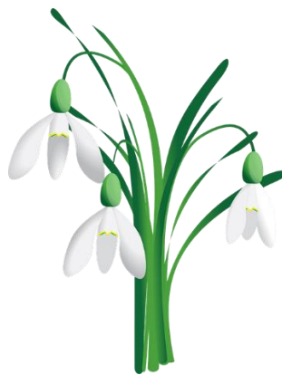
Perny og Øyvind